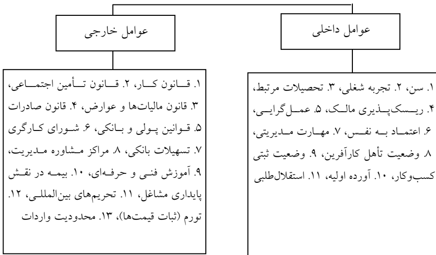
شکل ۲. عوامل مؤثر بر پایداری کسب‌وکار خرد از دید محققین

- مرحله ۲: پرسش‌نامه‌ای براساس مدل تصمیم‌گیری ساعتی تهیه گردیده و از کارآفرینان در خصوص میزان تأثیرگذاری عوامل و شاخص‌ها نظرسنجی شده است. پس از تجزیه و تحلیل نتایج حاصل، عواملی که نمره بیش از میانگین را کسب نمودند جهت رتبه‌بندی استخراج گردیده است (شکل ۳).